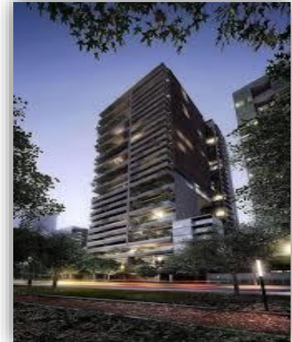
Rubén Darío Polanco - CDMX