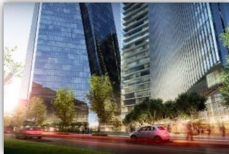
Be Grand Polanco - CDMX Restauración de Vidrio Rayado.