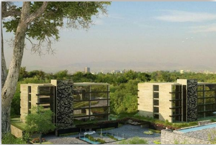
Reforma 2570 - CDMX Restauración de Vidrio Rayado.