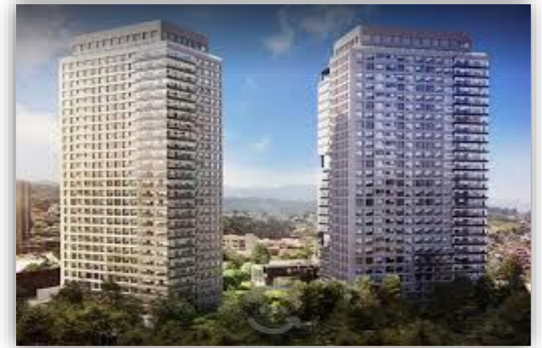
Be Grand Cuajimalpa Contadero - CDMX Restauración de Vidrio Rayado.