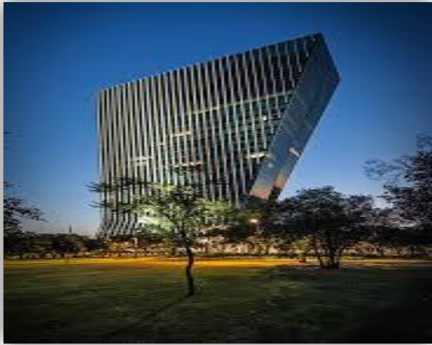
Pedregal 24 / Torre Virreyes - CDMX