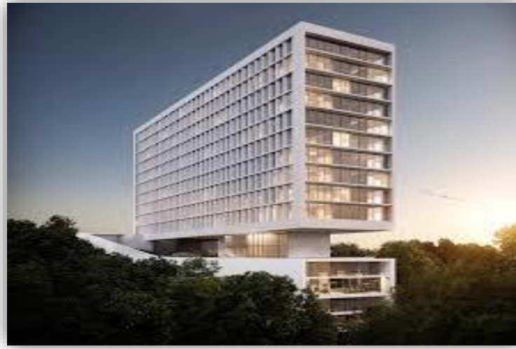
Punto Sur - Guadalajara Jalisco.