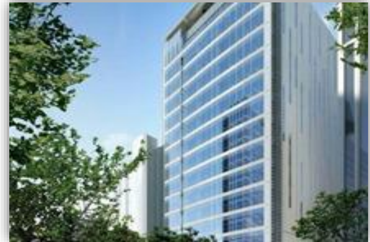
Insurgentes 700 - CDMX Restauración de Vidrio Rayado