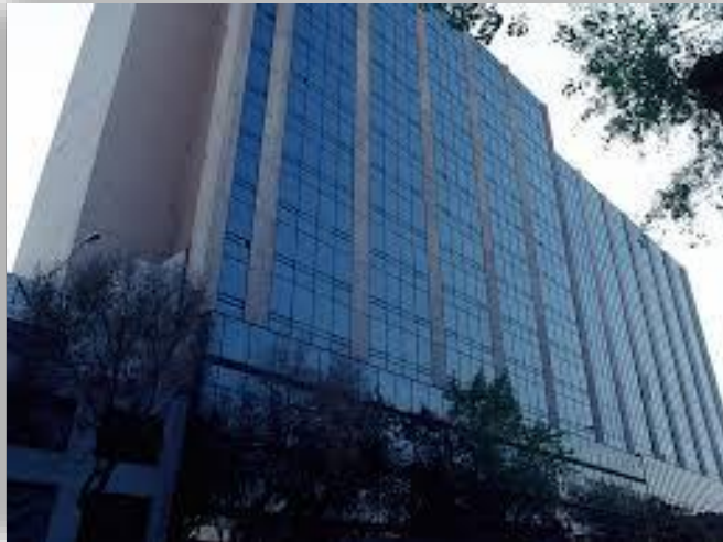
Mariano Escobedo 555 Polanco - CDMX