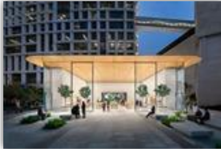
Apple Antara/Polanco - CDMX Restauración de vidrio rayado