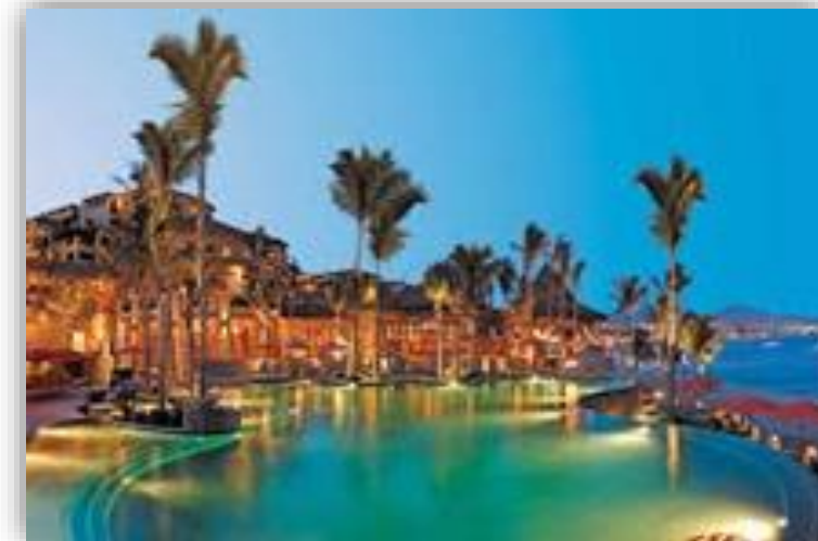
Hotel Hacienda, Beach Club & Residences Cabo San Lucas, B.C.S.