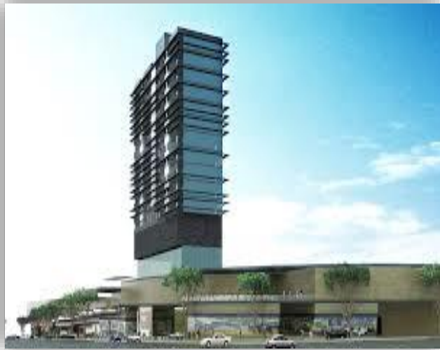
Minas 71 - Huixquilucan - Estado De México.