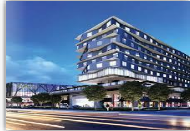
Centro Comercial Punto Valle - Mty N. L.