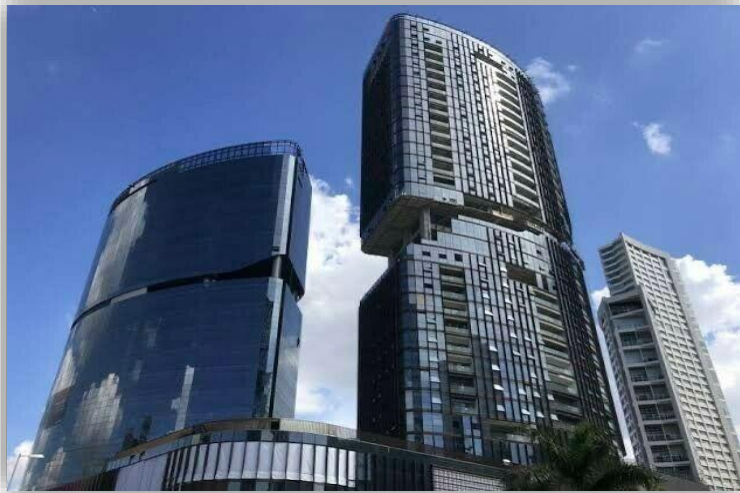
Land Mark - Guadalajara Jalisco Restauración de Vidrio Rayado