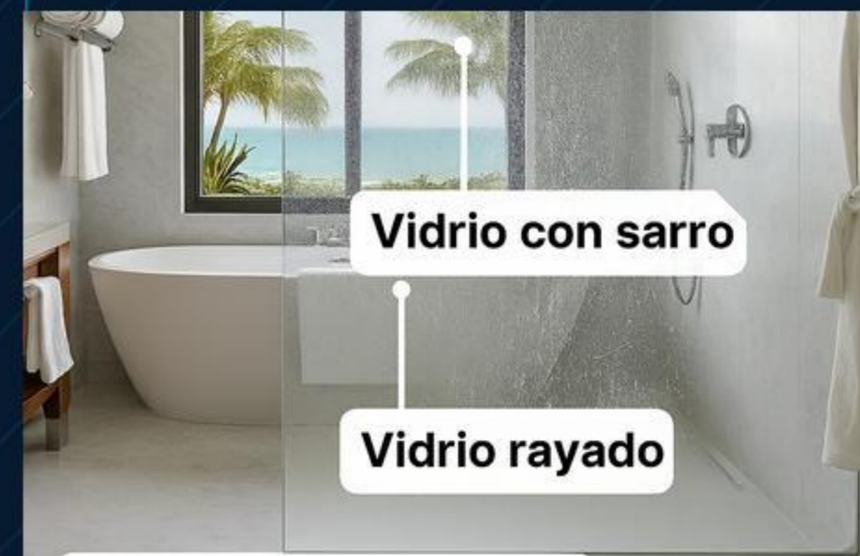
Canceles de baño y cristales en zonas húmedas

Cambiarlo no siempre es la mejor opción.