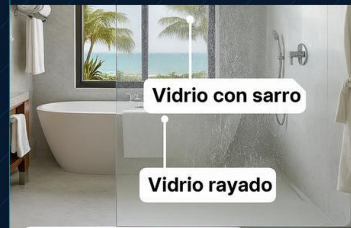
Zonas húmedas, spa, alberca y barandales

Objetivo: que el vidrio vuelva a transmitir limpieza, cuidado y calidad, sin cerrar áreas más tiempo del necesario.